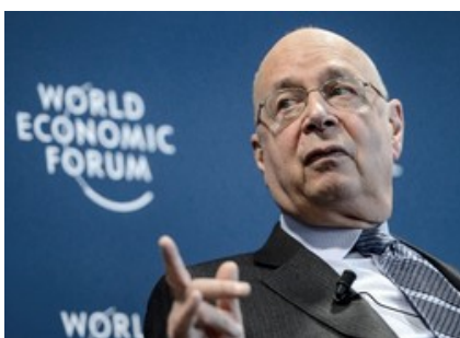
Prof. Klaus Schwab

Da "Resetting the Future" als "Weißbuch" bezeichnet wird, scheint es noch nicht die endgültige Fassung des teuflischen WEF-Planes zu sein. Es ist wohl ein erster Entwurf, ein Versuchsballon, mit dem die Reaktionen der Leser getestet werden sollen, denn es wirkt wie ein "Hinrichtungsbefehl". Da es vermutlich nicht viele Menschen lesen werden, wird es kaum Aufsehen erregen. Wenn die Menschen nämlich zur Kenntnis nähmen, was das WEF tatsächlich plant, würden sie sich vermutlich mit Waffengewalt dagegen zur Wehr setzen.