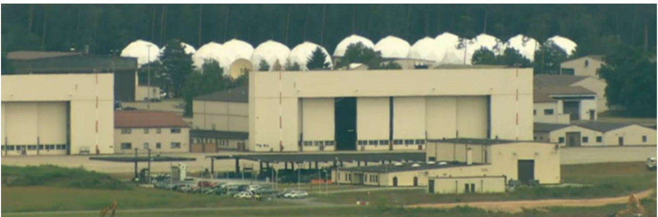
SATCOM-Relaisstation auf der Air Base Ramstein

[Vgl. nur: https://www.tagesschau.de/ausland/angriff-flughafen-bagdad-101.html ; https://www.zeit.de/politik/ausland/2020-01/irak-angriff-flughafen-raketen-beschuss-bagdad-tote-verletzte ; https://www.sueddeutsche.de/politik/qassim-soleimani-iran-usa-1.4744400-0 ; https://www.spiegel.de/politik/iran-rekonstruktion-der-toetung-von-qasem-soleimani-a-393afdbc-f714-4ae6-bb45-61bb855f76d4 ; https://www.forbes.com/sites/sebastienroblin/2020/01/04/did-the-pentagon-use-new-joint-air-to-ground-missiles-in-killing-of-general-soleimani/#1b9307234bb6 ]