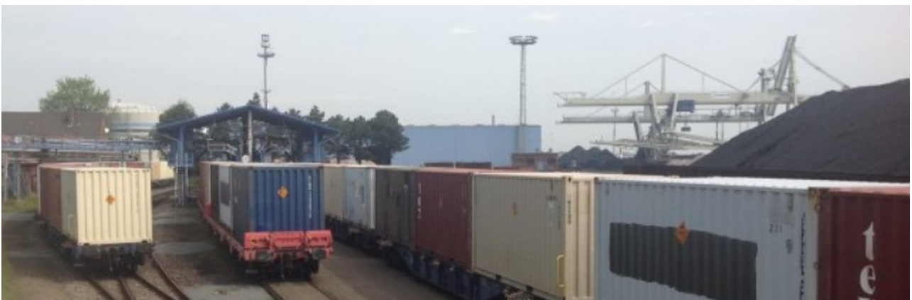
Munitionscontainer in Nordenham

Der Transport war Teil einer Übung aller US-Teilstreitkräfte, bei der es darum ging, eine große Menge Munition aus den USA gleichzeitig zu verschiedenen US-Regionalkommandos in Übersee zu befördern.