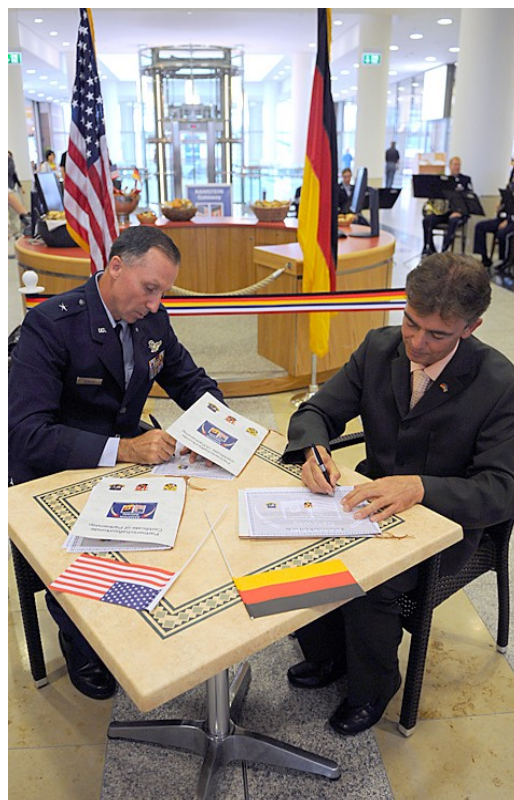
General Bender und der Ramsteiner Bürgermeister vor dem "Informationszentrum"

Das Zentrum liegt im Haupteingang in der Nähe des Ramstein Tickets & Tours / RTT (des US-Reisebüros) und der Shoppette (des ganztägig geöffneten Ladens für Tagesbedarf) und ist mit Angestellten einer einheimischen Arbeitsgemeinschaft besetzt, die von der Landesregierung, dem Kreis und der Stadt Kaiserslautern und der Stadt Ramstein-Miesenbach gebildet wurde.