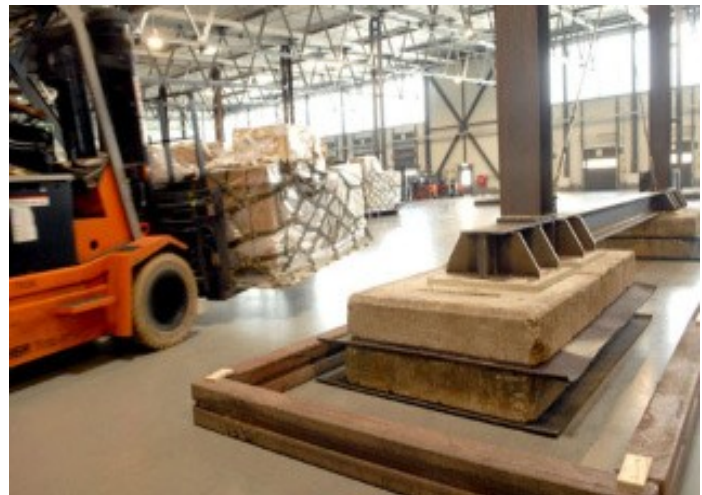
Massiver Betonplattenunterbau soll Einsinken verhindern

Der Ärger mit dem Terminal verlängert die wachsende Liste von Konstruktionsproblemen auf der größten Base des Verteidigungsministeriums in Europa. Das Gebäude liegt nur wenige Schritte von dem unfertigen, längst überfälligen Einkaufs- und Hotelkomplex (dem KMCC) entfernt, der mit so vielen Problemen behaftet ist, dass weder ein endgültiger Fertigstellungstermin noch die voraussichtlichen Kosten genannt werden können.